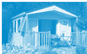
Cottage Zen 1 ch. Louisiane - Corsaire